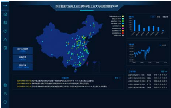
图 5：工业大电机能效管家平台 APP

以此项目为基础的“基于工业互联网平台的电力需求侧微网能量管理系统”项目被国家工业和信息化部列入的“2019年制造业与互联网融合发展试点示范项目”名录，建设基于综合能源大服务工业互联网平台，利用电力需求侧用户企业实时电力数据平台，整合用户生产、电力市场、气候环境的相关数据信息，加强能源需求侧管理，采用在满足生产电力能量要求的前提下的能量优化控制，实现实现能源动态分析及精准调度、负荷调整，进一步降低能源消耗，提高能源使用效率，有效降低电力用户企业在能源使用过程的运营成本。