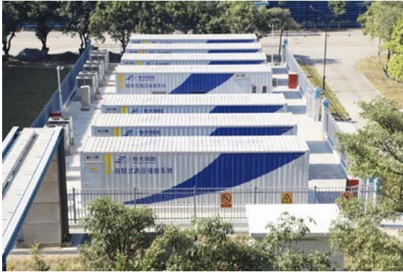
图 3：顺德五沙电厂储能系统

在储能电站领域，智光储能是级联型高压直挂储能技术的市场倡导与践行者，其高压级联型储能系统获得中电联组织的专家组“整体国际先进，部分指标国际领先”的评价。智光储能完成6kV储能系统、10kV储能系统、630kW高性能系列储能系统、6MW级储能检测平台、电池梯次利用储能系统的研制。6kV储能系统、10kV储能系统已通过中国电科院、广东电科院的现场技术测试，并承担相关标准的编制工作。报告期内五沙电热储能项目已投产，江苏万邦储能、茂名电厂、广州中新知识城粤芯电化学储能电站等储能项目正在建设中。