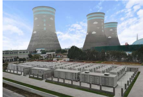
图 4：茂名电厂储能系统

在大容量SVC产品领域，完成高功率密度与高可靠性技术升级设计及升级后产品的投运，为后续进入更大容量SVC系统奠定坚实基础；基于GOOSE技术的第四代消弧控制器的样机研制工作基本完成，为后续消弧选线产品的功能与性能提升，提供了技术保障。