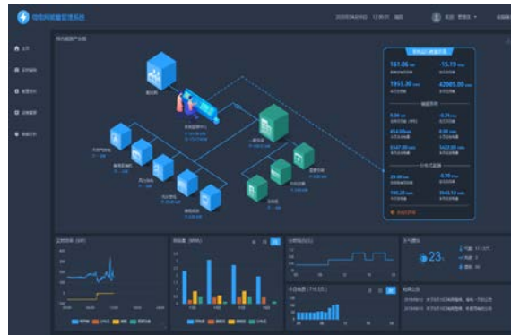
图 6：微电网能量管理系统 APP